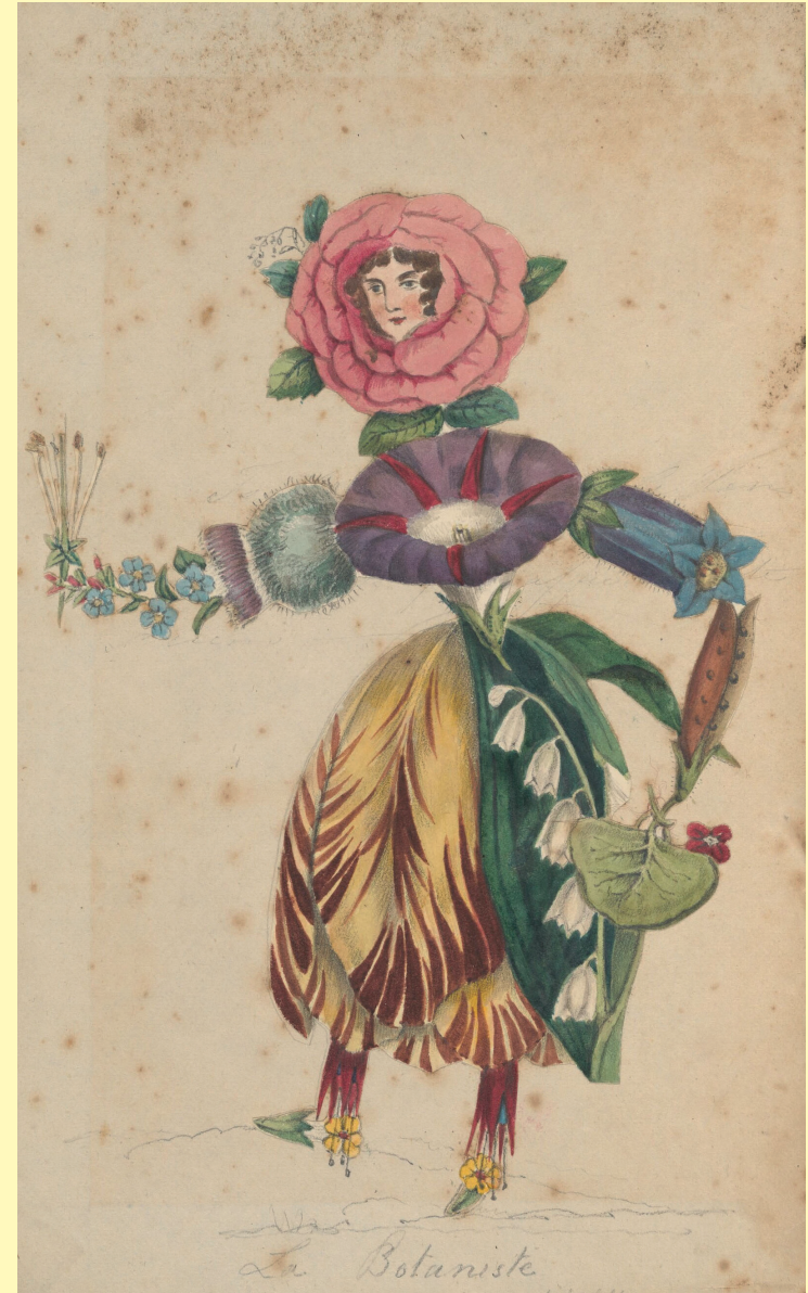
72a Botaniste, in George Spurr, Flora Medica, 1829 - Création graphique Tristan Pflumm, MSH Dijon